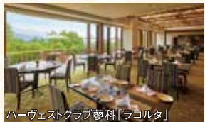
ハーヴェストクラブ蓼科「ラロカ」

蓼科本館、蓼科リゾート、グラマラスダイニング蓼科などのレストランをご利用いただけます。