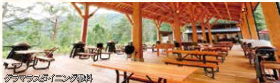
グラマラスダイニング蓼科