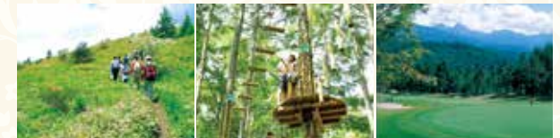
トレッキングコース

客室数:50室 ※総客室数55室(東急不動産所有分5室含む) / 温泉スパリゾート(露天風呂付温泉大浴場、屋内温泉プール、マッサージコーナー、休憩コーナー、ショップ) ※タウン内のレストランをご利用ください ※東急リゾートタウン蓼科:蓼科東急ゴルフコース、蓼科東急スキー場 他