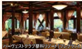
ハーヴェストクラブ蓼科リゾート「フレグラン」