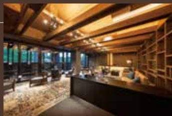
VIALA会員専用ラウンジ