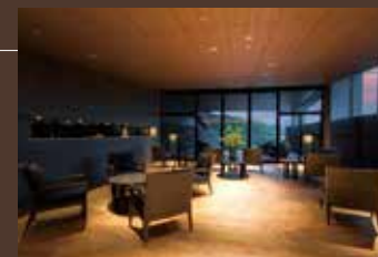
湯上がりラウンジ