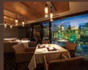
maison de forêt(フレンチ)

浅間山を眺めながら朝食を愉しむブッフェ「asama dining」、落ち着きと開放感を合わせ持つフレンチ「maison de forêt」、そして、庭園の四季を愛でる日本料理「新樹」。個性あふれる3つのダイニングがリゾート時間を演出します。