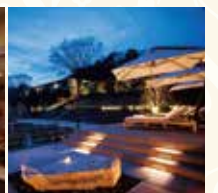
フォレストテラス