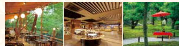
京料理 溪流床(夏季限定) 染織工芸館

客室数:83室 ※総客室数133室(VIALA annex京都鷹峯37室、東急不動産所有分13室含む) / ラウンジ / レストラン / 露天風呂付温泉大浴場 / スパ / 染織工芸館 しょうざんリゾート京都:レストラン(4ヶ所)