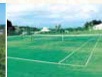
テニスコート(オムニコート)