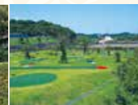
パターゴルフ(18ホール)