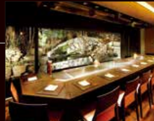
鉄板焼カウンター