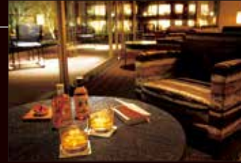
VIALA会員専用ラウンジ