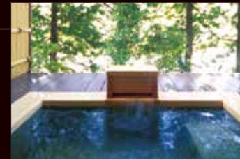
客室露天風呂 (VIALAデラックス・VIALAスイート) ※お部屋によって仕様異なります。