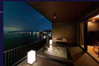
客室温泉露天風呂