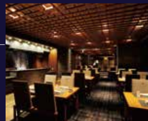
日本料理「菫(き)らく」

緑越しに海を望む日本料理「菫らく」、食と眺めを手軽に楽しむbuffet「Oli-va(オリヴァ)」、東館最上階にあるフレンチ「Côte & Ciel(コート・エ・シエル)」と、気分に合わせて食事のスタイルを選べます。