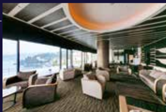
VIALA会員優先ラウンジ

クスノキに温かく迎えらるるエントランスを抜けると、落ち着いた落ち着いたロビーに、眺望テラスではゲストを包み込むように迎えてくれる海の眺めが広がります。