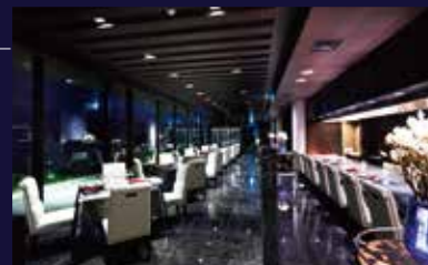
フレンチ「Côte & Ciel(コート・エ・シエル)」