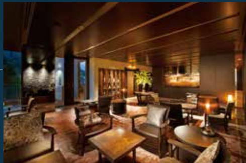
VIALA会員優先ラウンジ

開放的なロビーからVIALAへのエントランスを抜けると、上質でゆとりある特別な時間が始まります。VIALA会員優先ラウンジでは、プライベートな落ち着いた空間でのティータイムや読書など贅沢な大人の寛ぎのひと時をお過ごしいただけます。