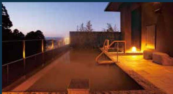
温泉露天風呂「金泉」

露天風呂に「金泉」、内風呂・家族風呂に「銀泉」を引いた大浴場。ジャグジーを備えた屋内温水プールやボディケアスタジオ、エステサロンで質の高いホスピタリティを目指します。