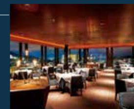
イタリアン「リストランテ アルトゥーラ」